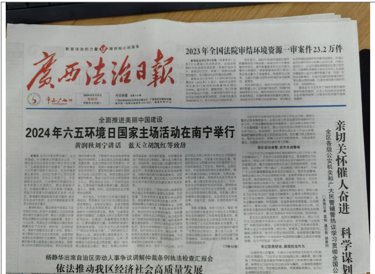
图 3-3 征求意见稿纸媒公示情况照片（2024 年 6 月 6 日）