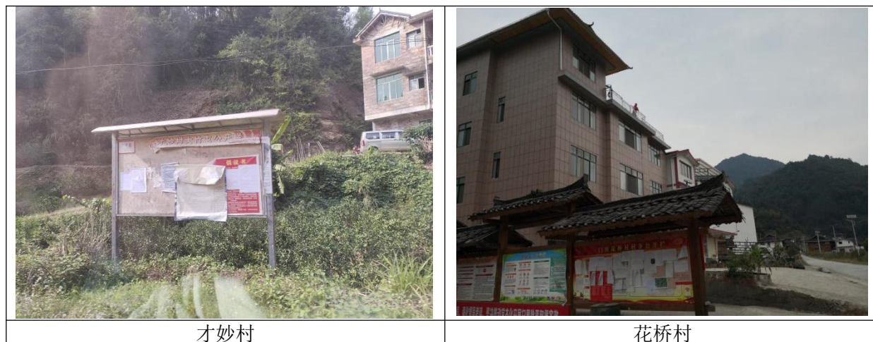
图 3-4 现场公示照片示意

在编制单位基本完成项目环境影响报告书编制工作后，我单位在项目所在区域单位、乡镇及村屯等公众易于知悉的公告栏上张贴公告公开，张贴区域选取符合《环境影响评价公众参与办法》要求。张贴现场照片见图 3-4。